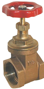
fig 302 schuifafsluiter brons max. druk 16 bar tot 2", 10 bar boven 2"

temp. : -10°C/+110°C 1/4"- 4" bsp niet-stijgende spindel en handwiel fig 301 : PN20 1/2" - 4" bsp fig 300NPT : 3/8" - 4" npt schroefdraad fig 301NPT : PN20 1/2" - 4" npt