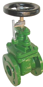
fig 330P schuifafsluiter PN10 huis gietijzer GG25 - GJL-250 bronzes dichting en spindel voorzien van standaanduiding DN40 - DN400 temp. : -10°C/+120°C inbouw lengte DIN 3202 F4 niet-stijgend handwiel en spindel