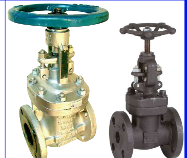
fig 375 schuifafsluiter 150 lbs huis staal ASTM A216'WCB Trim F6 flenzen volgen ANSI 150 LBS 2" - 12" temp. : -10°C/+400°C