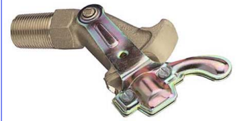
fig 306 siroopkraan pn16 1/2" - 2" : messing 2" - 2 1/2" : gietijzer

temp. : -30°C/+180°C 1/2" - 2" bsp niet-stijgende spindel en handwiel PTFE dichtingen fig 304NPT : 1/2" - 2" NPT