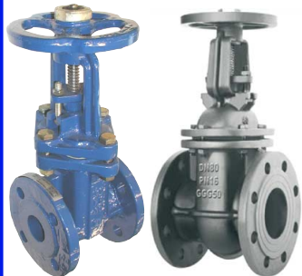
fig 340I schuifafsluiter PN10 huis gietijzer GG25 - GJL-250 inox afdichtingsring / inox spindel max. druk 10 bar tot dn150 / 6 bar hoger DN40 - DN400 temp. : -10°C/+120°C inbouw lengte DIN 3202 F4 niet-stijgend handwiel en stijgende spindel fig 342 : huis in modulair gietijzer GGG50