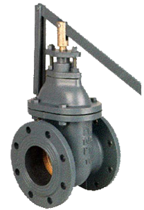
fig 331 snelsluit-schuifafsluiter PN10 huis gietijzer GG25 - GJL-250 messing afdichtingsring DN40 - DN300 temp. : -10°C/+120°C inbouw lengte DIN 3202 F4