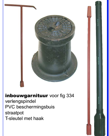
inbouw garnituur voor fig 334 verlengspindel PVC beschermingsbuis straatpot T-sleutel met haak