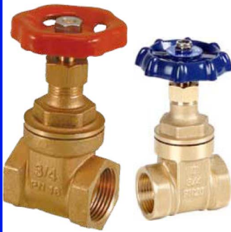
fig 300 schuifafsluiter messing max. druk 16 bar tot 2", 10 bar boven 2"

temp. : -10°C/+110°C 1/4"- 4" bsp niet-stijgende spindel en handwiel fig 301 : PN20 1/2" - 4" bsp fig 300NPT : 3/8" - 4" npt schroefdraad fig 301NPT : PN20 1/2" - 4" npt