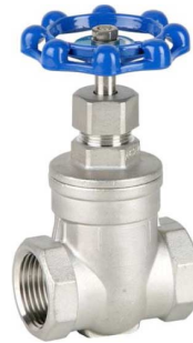
fig 304 schuifafsluiter inox max. druk 16 bar bij 120°C max. druk 10 bar bij 180°C

temp. : -10°C/+110°C 1/4"- 4" bsp niet-stijgende spindel en handwiel