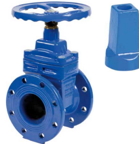
fig 334 schuifafsluiter PN16 huis modulair gietijzer GGG50 / epoxy coating EPDM rubber beklede schuif flenzen PN10/16 DN40 - DN600 temp. : -10°C/+110°C inbouw lengte DIN 3202 F4 niet-stijgend handwiel en spindel fig 334NBR : NBR rubber beklede schuif