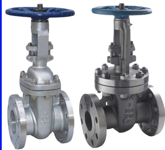
fig 354 schuifafsluiter in inox PN10 fig 355 schuifafsluiter in inox PN16 fig 356 schuifafsluiter in inox PN25 DN15 - DN600 temp. : -30°C/+400°C niet-stijgend handwiel en stijgende spindel