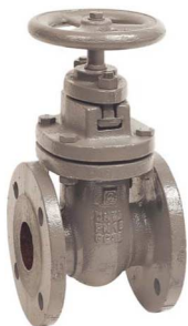
fig 330 schuifafsluiter PN10 huis gietijzer GG25 - GJL-250 messing afdichtingsring / inox spindel max. druk 10 bar tot dn150 / 6 bar hoger DN40 - DN300 temp. : -10°C/+120°C inbouw lengte DIN 3202 F4 niet-stijgend handwiel en spindel