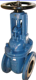
fig 370F4 schuifafsluiter PN10 huis staal GS-C25 inox dichting en spindel flenzen PN10 DN40 - DN400 temp. : -20°C/+425°C inbouw lengte DIN 3202 F4 niet-stijgend handwiel en stijgende spindel