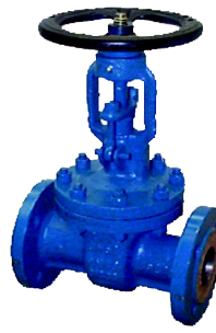
fig 370 schuifafsluiter PN16 fig 371 schuifafsluiter PN25 fig 372 schuifafsluiter PN40 fig 373 schuifafsluiter PN63 fig 374 schuifafsluiter PN100 huis staal GS-C25 DN40 - DN400 inbouw lengte DIN 3202 F5 niet-stijgend handwiel en stijgende spindel temp. : -20°C/+425°C