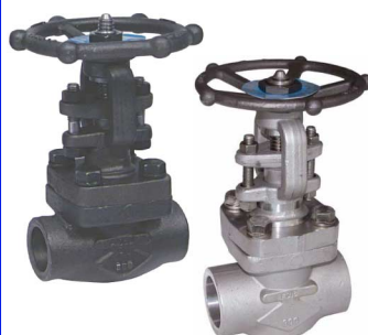
schuifafsluiters ansi 800 lbs fig 325 : staal 3/8"-2" npt schroefdraad fig 325bsp : staal 3/8"-2" bsp schroefdraad fig 326 : staal 3/8"-2" SW laseinden max. 138 bar temp. : -20°C/+440°C fig 327 : inox 316 3/8"-2" npt schroefdraad fig 328 : inox 316 3/8"-2" SW laseinden max. 138 bar temp. : -30°C/+440°C