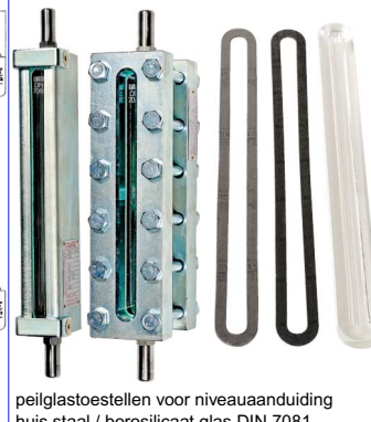
peilglastoestellen voor niveuaanduiding huis staal / borosilicaat glas DIN 7081 max. temp. : +280°C aansluiting buisjes diam. 16 mm / 60 mm lang fig 874 : met reflex glas (reserve gl. fig 876 ) fig 875 : met transparant glas reserve glas fig 877