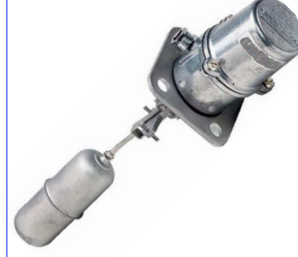
fig 871 inox vlotterafsluiter magnetisch vlottercontact inox 316 huis en vlotter temp. : max. +150°C 1 omwisselbaar schakelcontact max. 250V - 1,5 A