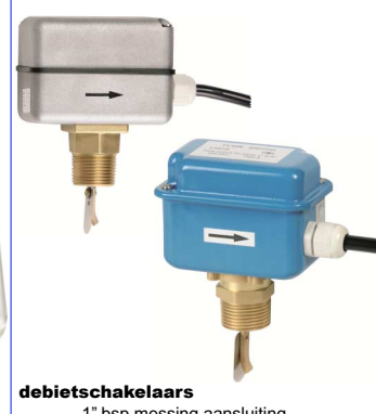
debietschakelaars 1" bsp messing aansluiting max. 10 bar / max. +110°C fig 895 : metalen kast IP54 fig 896 : aluminium kast IP64 schakelcontact 230V 10A