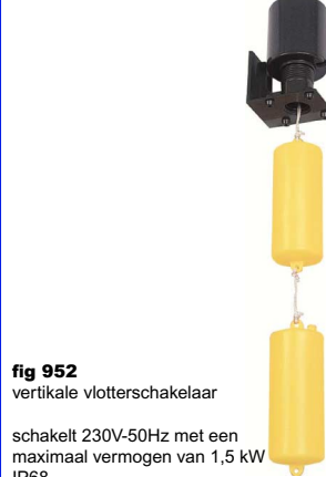
fig 952 vertikale vlotterafsluiter schakelt 230V-50Hz met een maximaal vermogen van 1,5 kW IP68 temp. : max +80°C