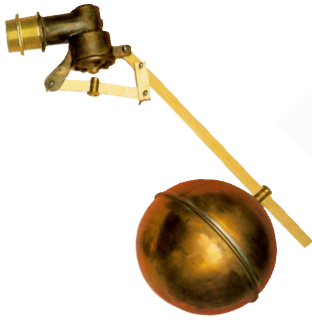
fig 960 messing vlotterafsluiter 1/2" - 2" bsp huis : messing verschuifbare vlotterbol : koper zitting : 1/2" - 5/4" messing zitting : 6/4" - 2" inox temp. : -5°C/+80°C