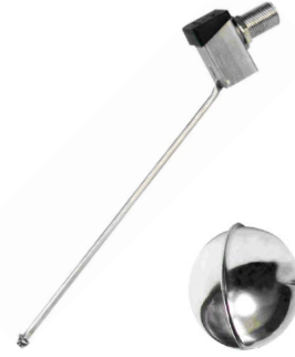
fig 963 inox vlotterafsluiter 3/8" - 4" bsp huis : inox 316 opschroefbare vlotterbol : inox 316 silicone klepdichting max. druk 10 bar temp. : -5°C/+150°C