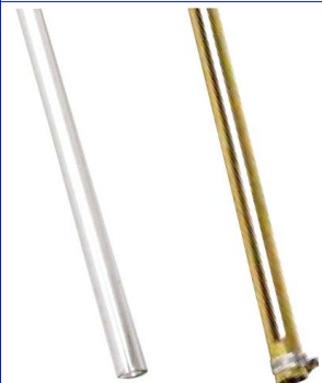
fig 892 plexiglas lengte 1 m diam. 10 - 13 - 16 - 18 - 20 mm fig 893 pyrex glas lengte 1,5 m diam. 10 - 13 - 14 - 16 - 18 - 20 mm fig 894 messing beschermhuis U lengte 1 m diam. 10 - 13 - 16 - 18 - 20 mm temp. : max +80°C