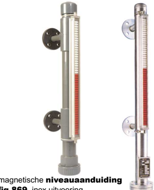
magnetische niveuaanduiding fig 869 inox uitvoering flenzen dn20 / lengte 800 - 1000 - 1200 mm fig 873 PVC uitvoering flenzen dn20 lengte 800 - 900 - 1000 - 1200 - 1400 mm