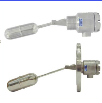
fig 882 inox vlotterafsluiter 1 1/2" bsp inox 316 huis en vlotter diam. 40 mm temp. : -20°C +150°C / max. druk 30 bar aluminium kast 1 kontakt max. 230V - 3,0 A fig 883 idem met flens PN10/16 DN40-DN100