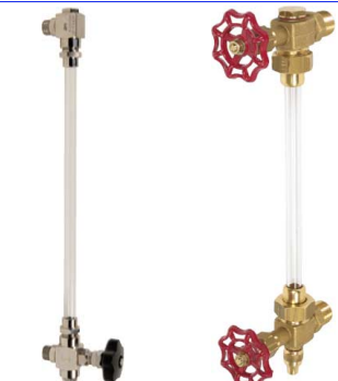
fig 891 inox niveuaanduiding (zonder glas) 3/8" - 1/2" - 1" bsp inox 316 naaldventiel en bocht max. druk 16 bar / temp. : -50°C +200°C viton en teflon afdichtingen fig 890 messing niveuaanduiding 1/4" - 3/8" - 1/2" - 3/4" bsp max. 6 bar/80°C