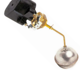
fig 872 vlotterafsluiter 1" bsp huis : messing vlotter diam. 70 mm in inox temp. : max. +125°C 2 schakelcontacten max. 250V - 1,5 A