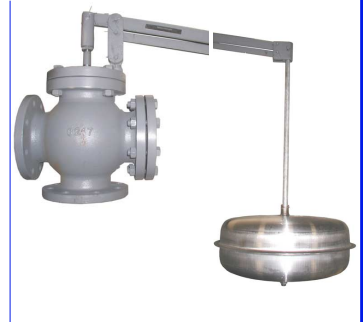
geflensde vlotterafsluiter pn16 rechte of haakse uitvoering dn50 - dn400 vlotterbol : inox 304 fig 966 : huis in gietijzer PN16 fig 967 : huis in staal PN16 fig 968 : huis in inox 316 PN16