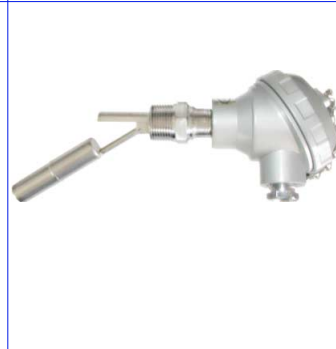
fig 881 inox vlotterafsluiter 1/2" - 3/4" bsp inox 316 huis en vlotter / aluminium kast temp. : -20°C +120°C max. druk 10 bar 1 kontakt max. 230V - 1,0 A