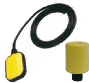
fig 950 horizontale vlotterafsluiter voorzien van 3 m kabel schakelt 230V-50Hz met een maximaal vermogen van 1,5 kW IP68 temp. : max +50°C