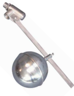
fig 962 inox vlotterafsluiter 3/4" bsp huis : inox 304 verschuifbare vlotterbol : inox 316 viton klepdichting temp. : -5°C/+90°C