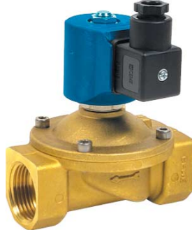
2-weg magneetventiel normaal gesloten directwerkend = geen verschilddruk nodig fig 623 : (VSO84) FF 3/8" - 2" bsp huis : messing NBR dichting temp. : -10°C +80°C 24 - 48 - 230 VAC / 12 - 24 VDC