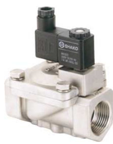
2-weg magneetventiel normaal gesloten minimum verschilddruk nodig : 0,5 bar fig 629 : (SPU225) FF 3/8" - 2" bsp huis : inox / viton dichting temp. : -10°C +90°C 24 - 48 - 230 VAC / 12 - 24 VDC fig 630 : (SPU225-X) FF 1/2" - 3/4" bsp Ex-uitvoering ATEX EEx m II 2G/D T4 voor zones 1, 21, 2 en 22