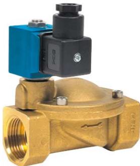
2-weg magneetventiel normaal gesloten minimum verschilddruk nodig : 0,3 bar fig 621 : (ESM86) FF 3/8" - 3" bsp huis : messing NBR dichting temp. : -10°C +80°C 24 - 48 - 230 VAC / 12 - 24 VDC fig 622 : normaal open(ESM87) FF3/8"-3"bsp