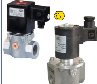
2-weg magneetventiel normaal gesloten voor gassen : aardgas-propaan-methaan-lpg fig 631 : (EVP) 1/2"-2" bsp -max 360 mbar huis : aluminium temp. : -20°C +60°C 24 - 230 VAC ATEX EEx II 3G/D voor zones 2 en 22 fig 632 : (EV-6) 1/2"-2" bsp - 6 bar