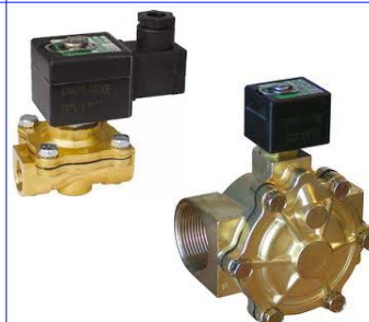
ASCO magneetventielen vloeistoffen - gassen - olie - lucht direct- of indirect werkend 24 - 48 - 230 VAC / 12 - 24 VDC Ex uitvoering mogelijk