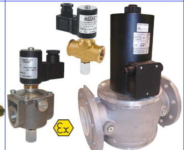
2-weg magneetventiel normaal gesloten met manuele reset voor gassen : aardgas-propaan-methaan-lpg 24 - 230 VAC ATEX EEx II 3G/D voor zones 2 en 22 gasdruk max. 500 mbar of 6 bar naar keuze fig 634 : (M14) 1/2"-1" bsp : huis messing : (M14) 5/4 - 2" bsp : huis aluminium fig 635 : (M16) DN65-DN300 : huis aluminium