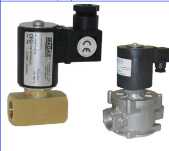
maneeventielen voor diesel / mazout volgens EN 264 normaal gesloten binnenwerk messing/inox / NBR dichting temp. : -5°C +60°C 24 - 230 VAC fig 625 : 3/4" - 2" / max 4 bar / messing huis fig 626 : 3/4" - 2" / max 8 bar / aluminium huis veer temp. : 0°C +60°C