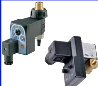
magneetventiel met ingebouwde timer 2-weg magneetventiel normaal gesloten wordt gebruikt als automatische aflatkraan fig 636 : 1/2" M x 3/8" M + slangpilaar 10 mm fig 637 : FF 1/8" bsp