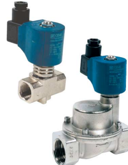
2-weg magneetventiel normaal gesloten minimum verschilddruk nodig : 1,0 bar fig 624 : (ESV80) FF 1/2" - 2" bsp huis : messing teflon dichting temp. : -40°C +180°C 24 - 48 - 230 VAC / 12 - 24 VDC