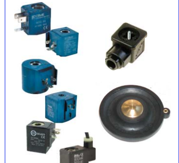
onderdelen reservestoelen 24 - 48 - 230 VAC / 12 - 24 VDC connectors membranen