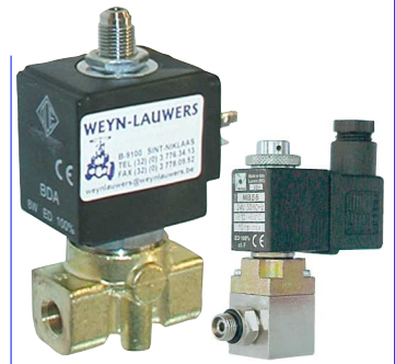
3-weg magneetventiel directwerkend = geen verschilddruk nodig fig 600 : FF 1/8" - 1/4" bsp huis : messing viton dichting temp. : -10°C +140°C 24 - 48 - 230 VAC / 12 - 24 VDC fig 601 : MF 1/8" bsp