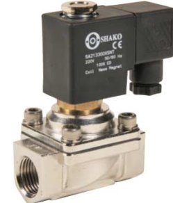
2-weg magneetventiel normaal gesloten directwerkend = geen verschilddruk nodig fig 627 : (SPU220) FF 1/2" - 3/4" bsp huis : inox / viton dichting temp. : -10°C +90°C 24 - 48 - 230 VAC / 12 - 24 VDC fig 628 : (SPU220-X) FF 1/2" - 3/4" bsp Ex-uitvoering ATEX EEx m II 2G/D T4 voor zones 1, 21, 2 en 22