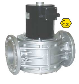
2-weg magneetventiel normaal gesloten voor gassen : aardgas-propaan-methaan-lpg fig 633 : (EVP) DN65-DN80-DN100 flenzen max 360 mbar huis : aluminium temp. : -20°C +60°C 24 - 230 VAC ATEX EEx II 3G/D voor zones 2 en 22