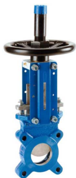
fig 380 plaatafsluiter / flenzen PN10 huis gietijzer + rilsan coating plaat en spindel RVS304 1-zijdig dichtend DN50 - DN800 NBR dichting : temp. : -10°C/+80°C bediening met handwiel, niet stijgend stijgende spindel fig 380M : metaaldichtend