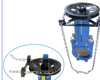
kettingwiel voorzien van kettinggeleider