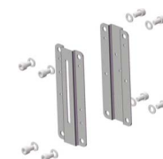
inox frame-plates geschikt voor fig 380I DN50 - DN400