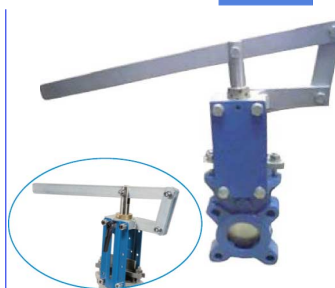
hendel set geschikt voor fig 380 en fig 380I