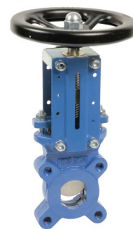
fig 387 plaatafsluiter / flenzen PN10 huis gietijzer + rilsan coating vlinder nodulair gietijzer vernikkeld 2-zijdig dichtend DN50 - DN400 NBR dichting : temp. : -10°C/+80°C bediening met handwiel, niet stijgend niet-stijgende spindel