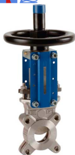
fig 380I plaatafsluiter / flenzen PN10 huis RVS316 plaat en spindel RVS316 1-zijdig dichtend DN50 - DN400 EPDM dichting : temp. : -15°C/+110°C bediening met handwiel, niet stijgend stijgende spindel