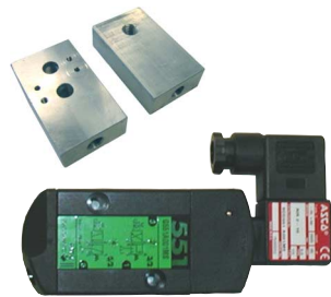
stuurventiel 5/2 monostabiel gemonteerd op aluminium NAMUR montageplaat